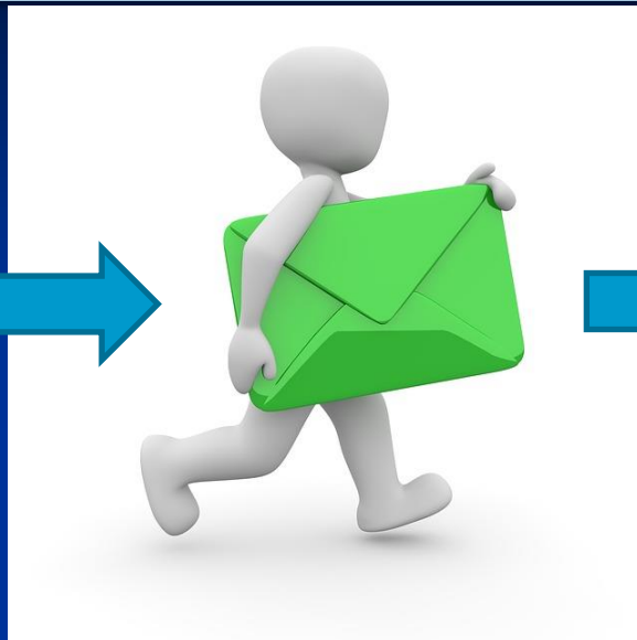
Уведомление о заинтересован- ности